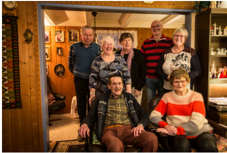
Vårbud sjømannskirkeforening 100 år, Vestnes, 2024

Regionrådet bør se på mulighetene for å danne nye grupper. Kanskje er det flere tidligere uteansatte i et område som kunne få en utfordring? Kanskje er det flere medlemmer som bor i nærheten av hverandre som kunne ha glede av å møtes som ei gruppe? I slike tilfelle kan regionstyret fungere som en initiativtager.