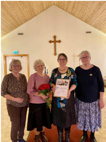
Sjøstjernen sjømannskirkeforening 50 år i 2024